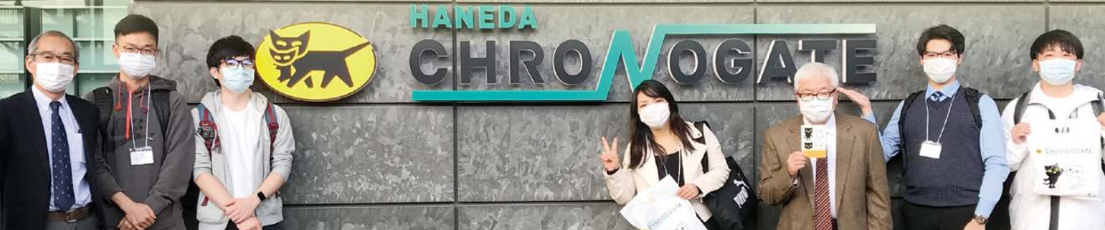
写真の関連記事は、「Activity2 ヤマト運輸(株)の羽田クロノゲートの見学(インターフェース支援プログラム・企業実務見学)」をご覧ください。